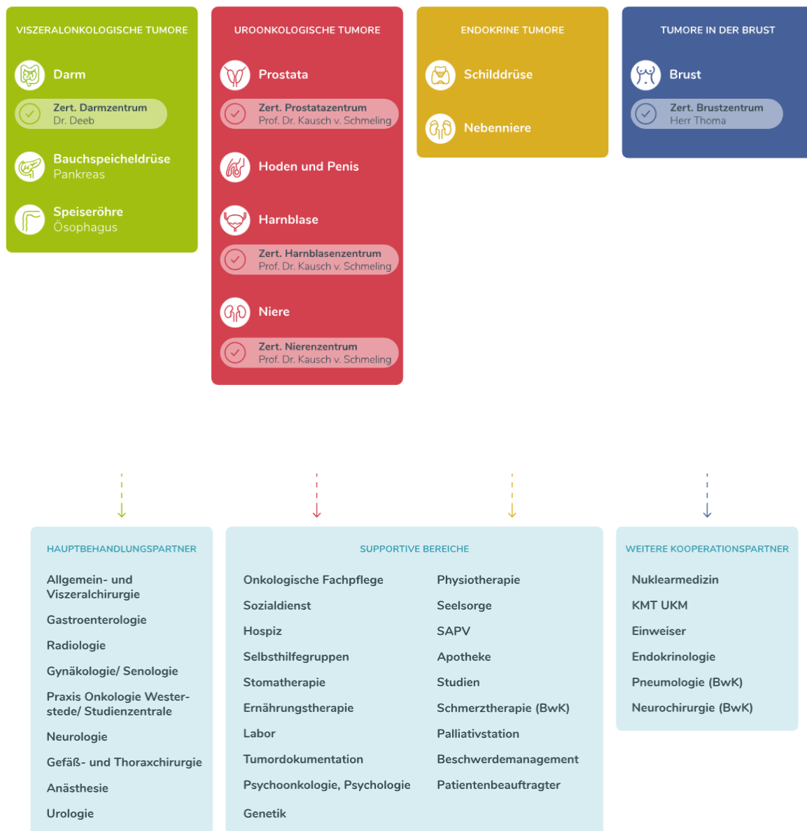
Abb. 2: Struktur und Interne Fachbereiche des Onkologischen Zentrums Westerstede

Ferner bestehen im Rahmen des Onkologischen Zentrums Kooperationen mit den folgenden externen Behandlungspartnern: